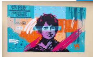
7.- ROSALÍA DE CASTRO. 2021