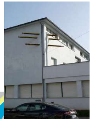
12.- OS LAPIS DA CULTURA (II) Autor: Felipe Piñuela