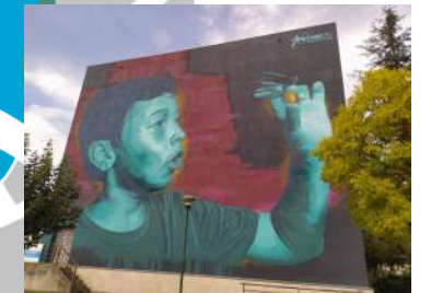
14.- NENO COA OLIVA. 2021 (Aceite de Quiroga) Autor: Mon Devane