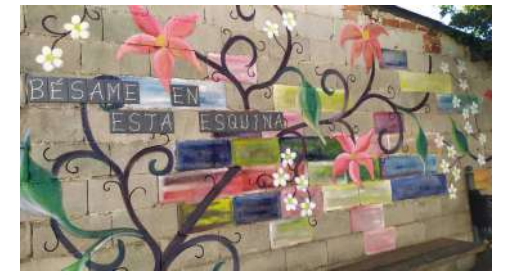
9.- BÉSAME EN ESTA ESQUINA. 2021 Autor: José Luis Lemos