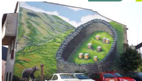
5.- ALVARIZA. 2020 Autor: Germán González