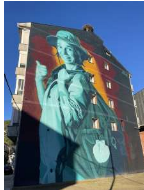
4.- PEREGRINA DO CAMIÑO DE INVERNO. 2021 Autor: Mon Devane