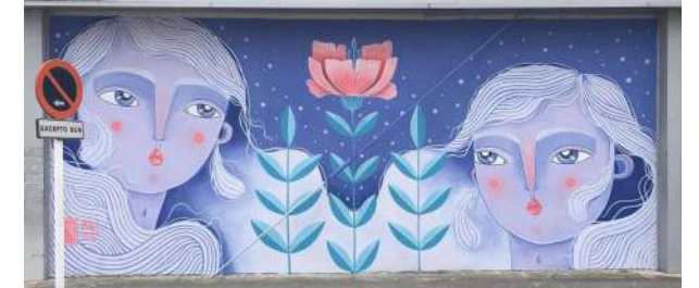
10.- SORORIDADE. 2020 Autora: Abi Castillo