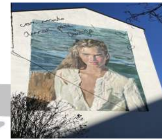
8.- XOVE NA BEIRA DA AUGA. 2021 Autor: Iván Floro - Van Vuu