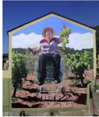
3.- ERUNDINA "A SUPERAVOA VENDIMADORA". 2020 Autor: José Muruzábal - Yoseba MP