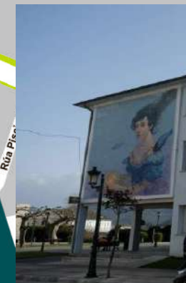
13.- A LAVANDEIRA DO SIL. 2015 Autor: Miguel Peralta e Xoana Alma (Cestola na Cachola)