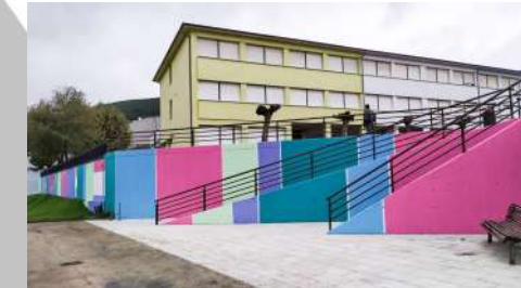
11.- ESCALA CROMÁTICA. 2020 Autor: Obradoiro Emprego Sillor IV